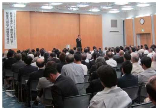
セミナー：梨田昌孝氏 (元 日本ハムファイターズ監督)